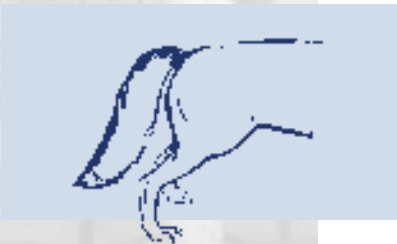
Abb. 5: Schwanzhaltung - Normale Haltung -