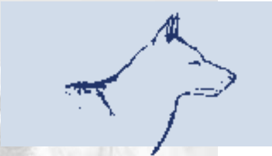
Abb. 3: Gesichtsausdruck - aufmerksam -