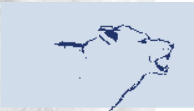
Abb. 4: Gesichtsausdruck - drohend -