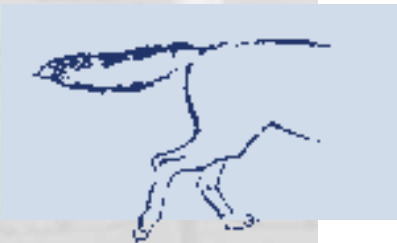
Abb. 6: Schwanzhaltung - Angriff -