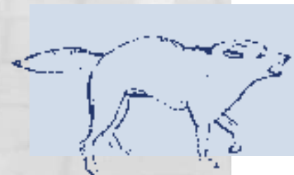
Abb. 2: Körperhaltung - drohend -

Zähneflitschen und Knurren bei angelegten Ohren können Anzeichen für einen Angriff sein.