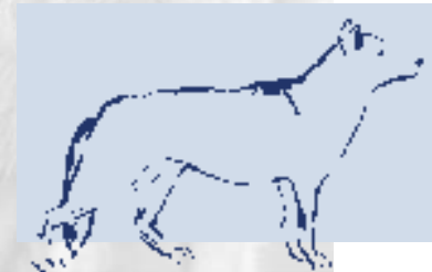
Abb. 1: Körperhaltung - aufmerksam -

Mehr Sicherheit beim Umgang mit den Vierbeinern erhalten Sie, wenn Sie die Körpersprache verstehen.